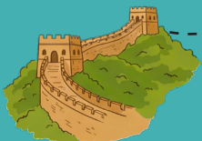
Velká čínská zeď