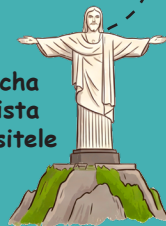
Socha Krista Spasitele