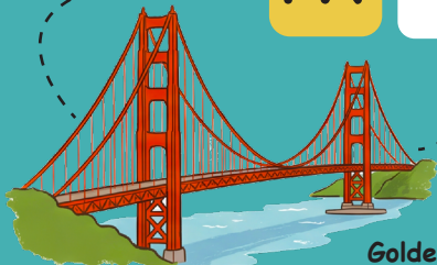
Golden Gate Bridge